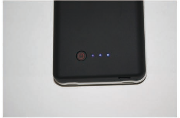
電量指示燈, 4 格為全滿狀況

BL-1900P, 可獨立充電, 容量有 1900mAh, 當 iPhone 4 (or iPhone 4s) 電源不足時, 長按 BL-1900P 背蓋的電源鍵 3 秒, BL-1900P 會以其電力回充給 iPhone 4 or iPhone 4s 本機的電池, 使您的 iPhone 4 or iPhone 4s 擁有了更長的使用時間。