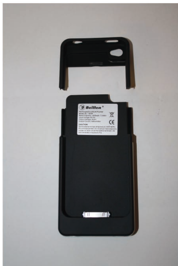
將上蓋往上拉開，將 iPhone 4 裝入