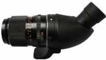
CANON M42-135 mm(定焦鏡)