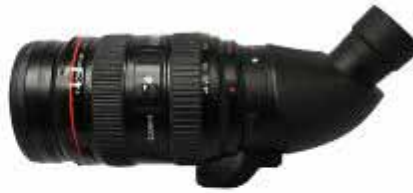
CANON 24-70 mm(變焦鏡)