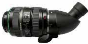
CANON 70-300 mm(變焦鏡)