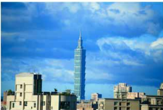
數位相機全幅拍攝